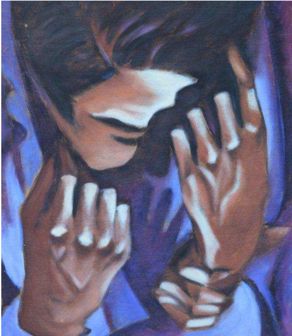
Olieverfschilderij op hout. JOS DE DECKER