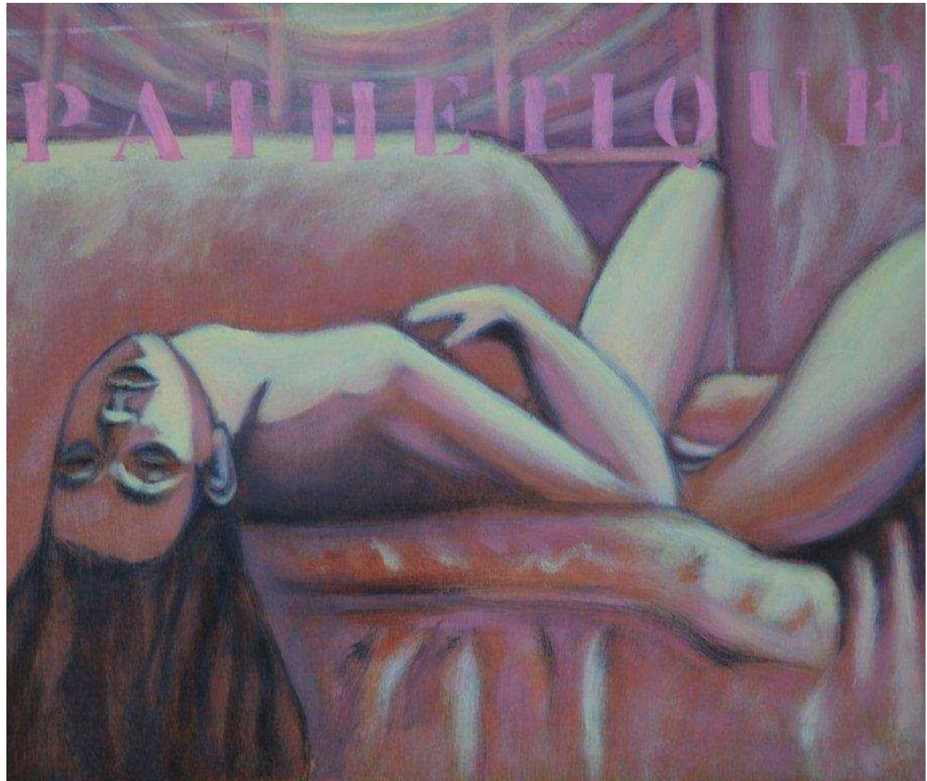
PATHETIQUE- Olieverfschilderij op hout – Jos De Decker